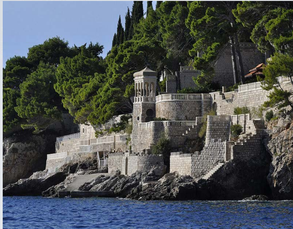
Ciudad medieval de Malta Desembarco del Rey en la serie de TV Juego de Tronos