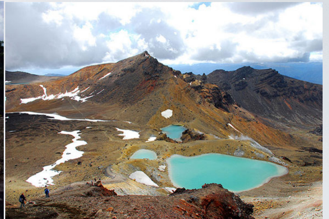
Parque Nacional Tongariro (Nueva Zelanda) Trilogía El Señor De los Anillos