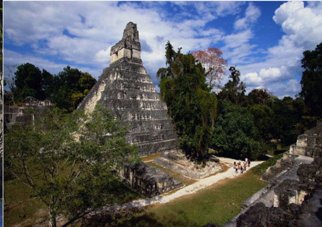
Parque Nacional de Tikal (Guatemala) Star Wars: Episodio IV