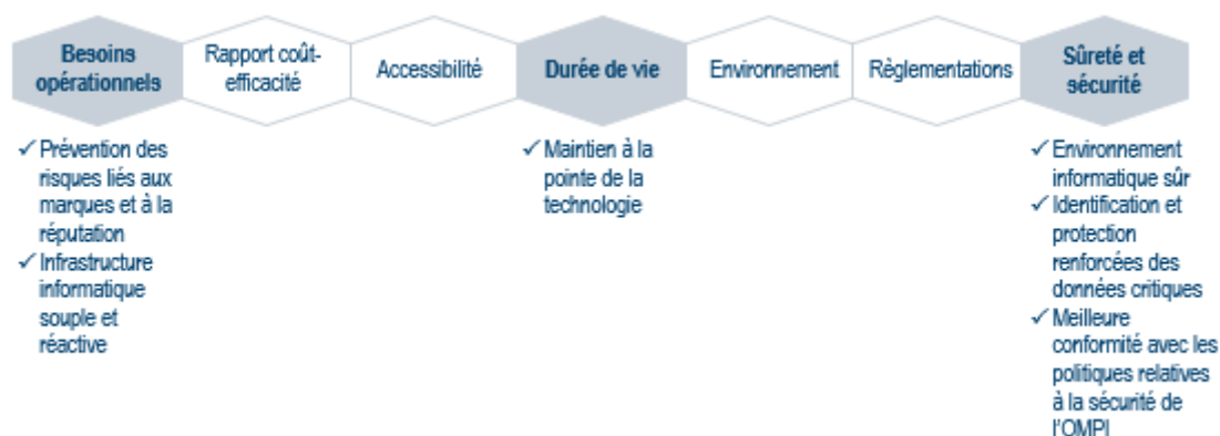
Figure 1 : Principaux facteurs déterminants de la phase hybride de la plateforme résiliente et sécurisée pour le PCT

9. Il convient de souligner que les propositions exposées ci-dessus sont nécessaires afin que le PCT ne se retrouve pas à la traîne avec une infrastructure vieillissante et de plus en plus vulnérable. Si cette décision n'est pas prise, le profil de risque passera de moyen à élevé dans l'année à venir, ce qui va à l'encontre de la déclaration relative au risque accepté (3.2 – Renforcement de la productivité et de la qualité des systèmes mondiaux, services, savoirs et données de propriété intellectuelle de l'OMPI (risque accepté : faible) et 5.2 – Information et communication (risque accepté : faible)). En outre, si les investissements proposés pour l'avenir du système du PCT ne sont pas entrepris, le risque d'une atteinte réussie à la sécurité du système du PCT augmentera, ce qui, à son tour, pourrait gravement nuire à la réputation de l'OMPI et à la confiance dans les services du PCT.