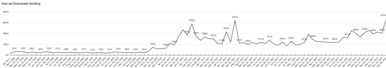
الشكل 2 - متوفر بالإنجليزية فقط

36. ومنذ أبريل 2020، أصبحت جميع الأدوات والمواد المرجعية متوفرة على صفحة الويبو الإلكترونية المخصصة للمشروع . وبحلول منتصف يناير 2022، كان الموقع الإلكتروني قد استقبل ما مجموعه 9453 زائراً وسجّل مرات تنزيل بمجموع 17922 مرة، مما يدل على نجاح الأدوات ومصادر التعلم والبحوث والرسوم البيانية. وشهدت الأشهر الثمانية الأولى لهذا الموقع 47 مرة تنزيل شهرياً في المتوسط، وبدأ المعدل في الزيادة بشكل كبير في ديسمبر 2020 ليصل إلى ذروته بعد عام واحد من إطلاق الموقع في أبريل 2021 حيث سجّل 642 مرة تنزيل في الفترة من 18 أبريل إلى 2 مايو 2021.