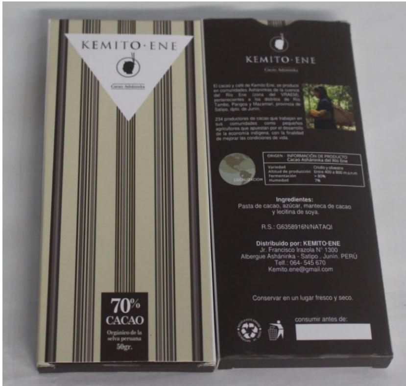
Chocolate al 70% de cacao