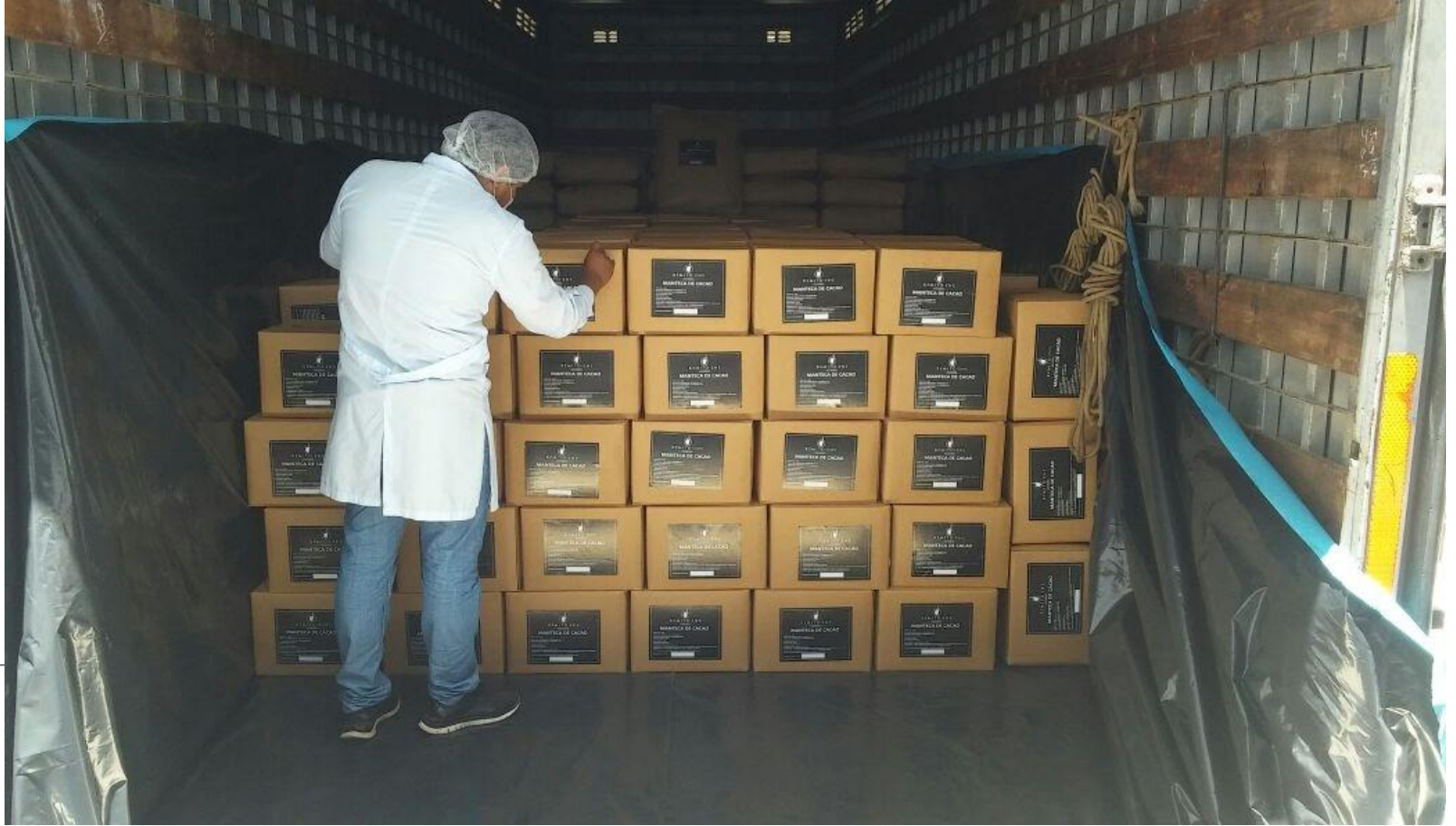
Manteca de cacao exportable