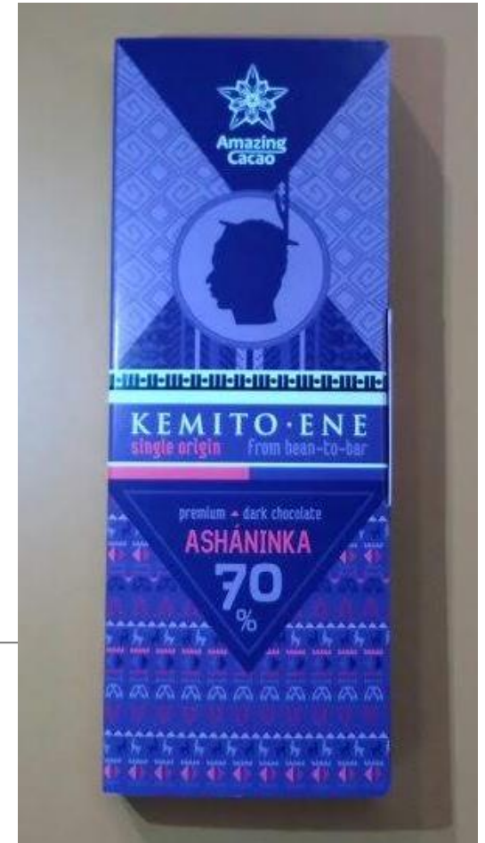
Chocolates Marca Kemito Ene cacao Asháninka en Rusia