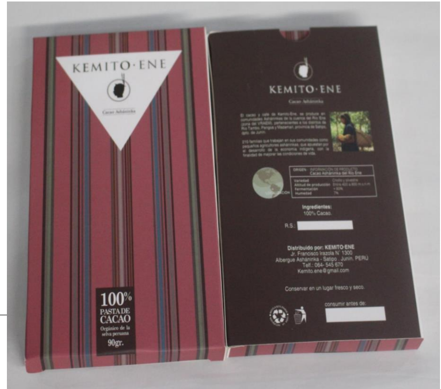
Pasta de cacao