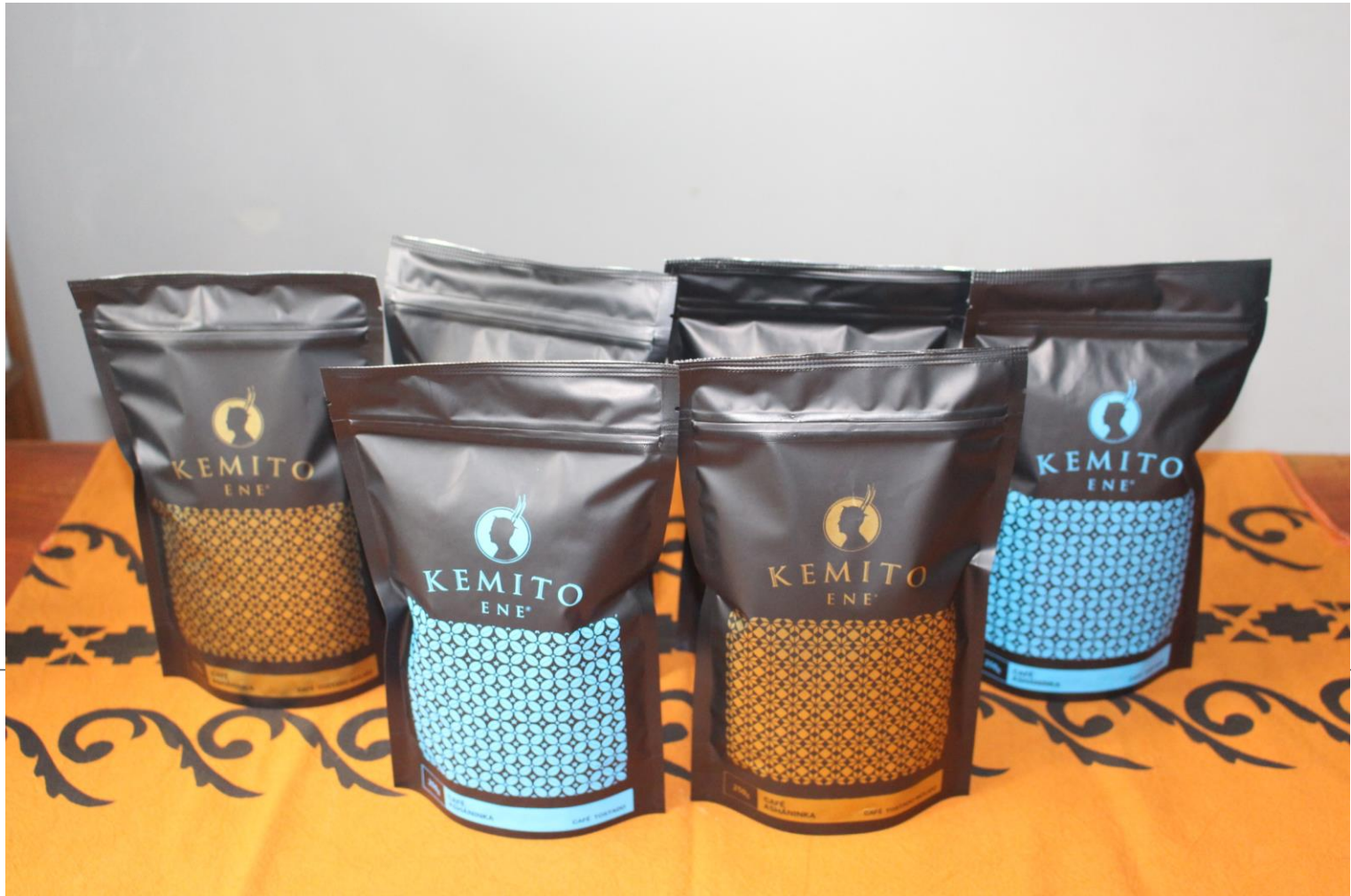
Café tostado entero y molido