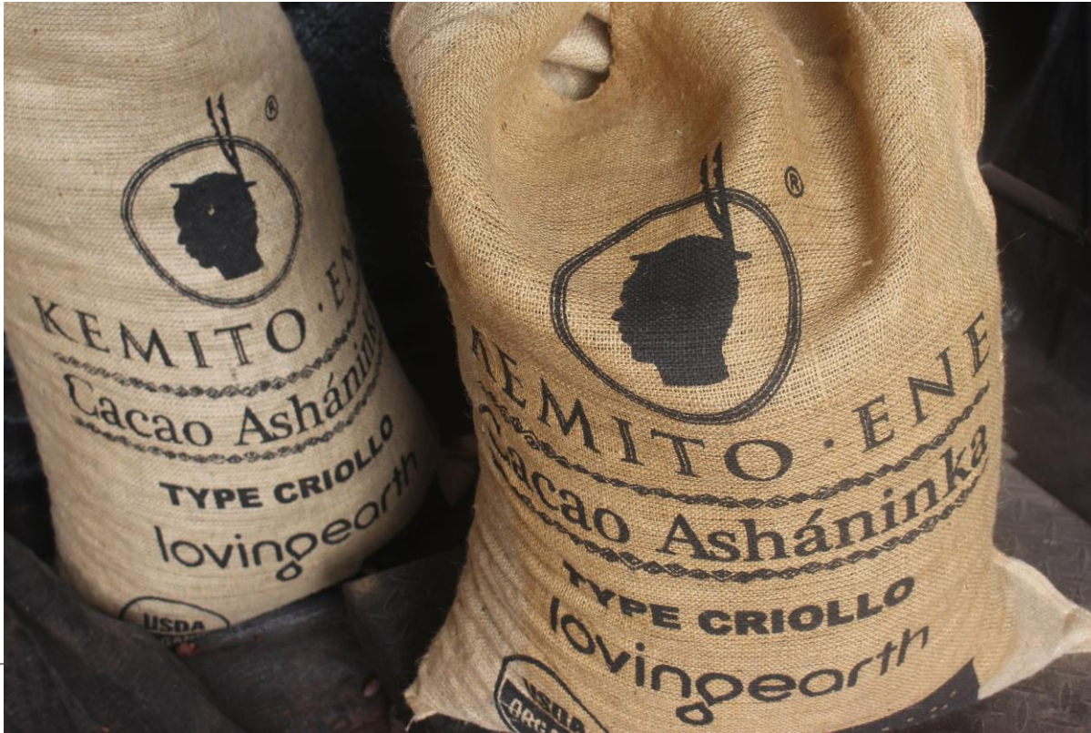
Grano de cacao exportable