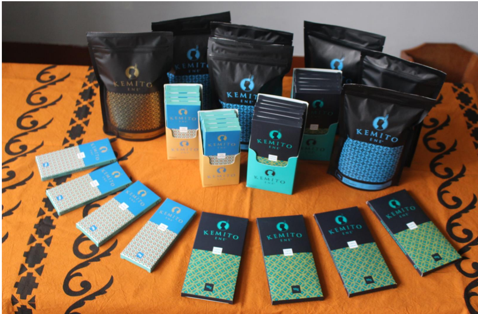
Productos Kemito Ene