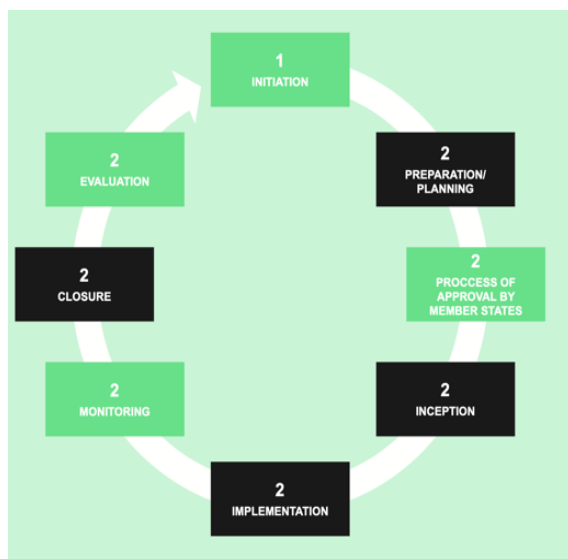
Рисунок 1. Блок-схема жизненного цикла проекта ПДР (только на английском языке)

1. Благодаря Повестке дня в области развития (ПДР) Всемирной организации интеллектуальной собственности (ВОИС) соображения развития являются неотъемлемой частью работы ВОИС. Результативная реализация ПДР, в том числе интеграция ее рекомендаций в основные программы ВОИС, является важнейшим приоритетом. Проекты ПДР ВОИС отличаются от остальных проектов ВОИС. Проекты ПДР, как правило, направлены на реализацию одной или нескольких рекомендаций ПДР 1 . Проекты ПДР должны быть ориентированы на развитие, т.е. обеспечивать устойчивые результаты и оказывать влияние на различные области интеллектуальной собственности (ИС). Проекты ПДР разрабатываются таким образом, чтобы их можно было реализовать в разных частях света. Отдел координации деятельности в рамках Повестки дня в области развития (ОКПДР) дает государствам-членам рекомендации в ходе разработки проектов. Сотрудниками ОКПДР была подготовлена инфографика, представленная на Рисунке 1, где перечислены все этапы, необходимые для утверждения проектного предложения.