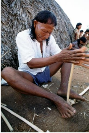
Indios Shavante usando palos de Buriti para hacer fuego