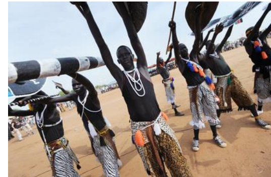
Danzantes tradicionales durante la marcha de la pre-independencia y rally del “Sudan People's Liberation Movement”