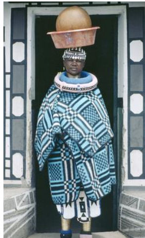
Mujer de la tribu Ndebele llevando un contenedor de cerveza tradicional