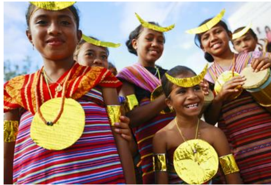
Timorese con trajes tradicionales participando en una ceremonia