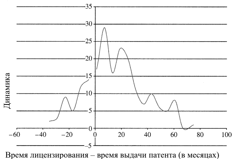
График 2. Связь между временем решения о выдаче патента и временем заключения лицензионных соглашений

На графике № 2 показана динамика заключения лицензионных соглашений до и после решения о выдаче патента. Цифры слева от нуля указывают на количество лицензионных соглашений, заключенных до получения решения о выдаче патента, а данные справа от нуля обозначают число лицензионных сделок, заключенных после вынесения такого решения 33 .