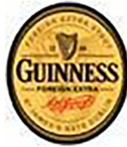
Etiqueta de Diageo Irlanda para la cerveza Foreign Extra Stout de GUINNESS®.

marcas para la planificación fiscal cuando estas se transfieren a una sociedad de cartera (en una jurisdicción con un nivel de imposición fiscal bajo), que cobra a sus empresas concesionarias (en jurisdicciones con un nivel de imposición fiscal alto) regalías por la utilización de las marcas.