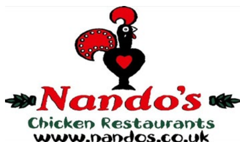
Imagen procedente de la Publicación de la OMPI N.º 900.1. El secreto está en la marca: Introducción a las marcas dirigida a las pequeñas y medianas empresas, pp.79.