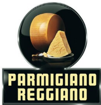
Imagen procedente de la Publicación de la OMPI N.º 900.1. El secreto está en la marca: Introducción a las marcas dirigida a las pequeñas y medianas empresas, pp.22.