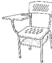
Silla Conferencia - 02062947 Industrias metálicas Cruz Colombia S.A.S.

En lenguaje corriente, suele entenderse por diseño industrial el conjunto que integran la forma y la función de un producto. Se dice que un sillón tiene “un buen diseño” cuando resulta cómodo y agradable a la vista. En el mundo de la empresa, diseñar un producto supone normalmente elaborar sus características estéticas y funcionales, teniendo en cuenta aspectos como la posibilidad de comercializar el producto, los costos de fabricación y la facilidad de transporte, almacenamiento, reparación y eliminación al final de su ciclo de vida.