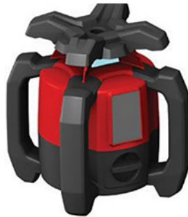
Láseres rotativos - DM/082519 HILTI AKTIENGESELLSCHAFT

Existen diseños que se encuentran protegidos no solo por derechos sobre el diseño sino también por derechos derivados de la marca y por derechos de patente.