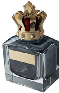
Botella de Perfume - NC2021/0006667ANTONIO PUIG, S.A.