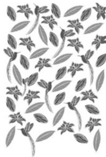
Patrón de decoración - NC2020/0007061 ANA CRISTINA PEREZ CARVAJAL