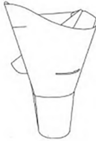
Vaso - 11086418 FRISBY S.A.