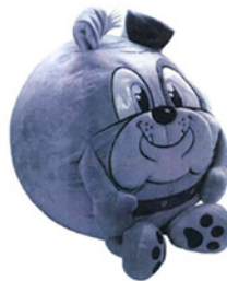
Juguete - 14232679 PELANAS S.A.S.