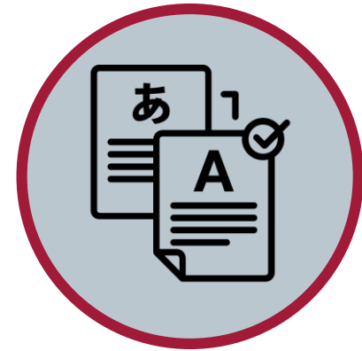
번역문 제출 (필요한 경우)