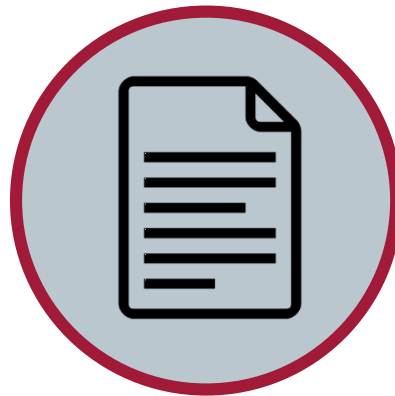
PCT 출원의 사본 제출 (공개 전)