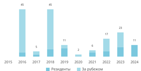
Число классов товарных знаков в заявках

Ведущие классы Ниццкой классификации; доля