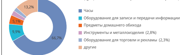
Ведущие классы Локарнской классификации; доля