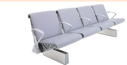
Чопи шудааст бо иҷозати: TRAX®

Италия, Чопон ва дар ИМА ҳифз карда мешавад. Мавҷуд будани намунаи саноатии ҳифзшаванда дар ин мамлакатҳо ба ширкати OMK Design Ltd хуқуқи истисноии тиҷоратикунони маҳсулоти худро медиҳад. Дар баъзе ҳолатҳо OMK Design Ltd ба ширкатҳои хориҷӣ литсензияҳоро барои истеҳсолкунии ин системаи курсиҳо дар асоси роялти додааст.